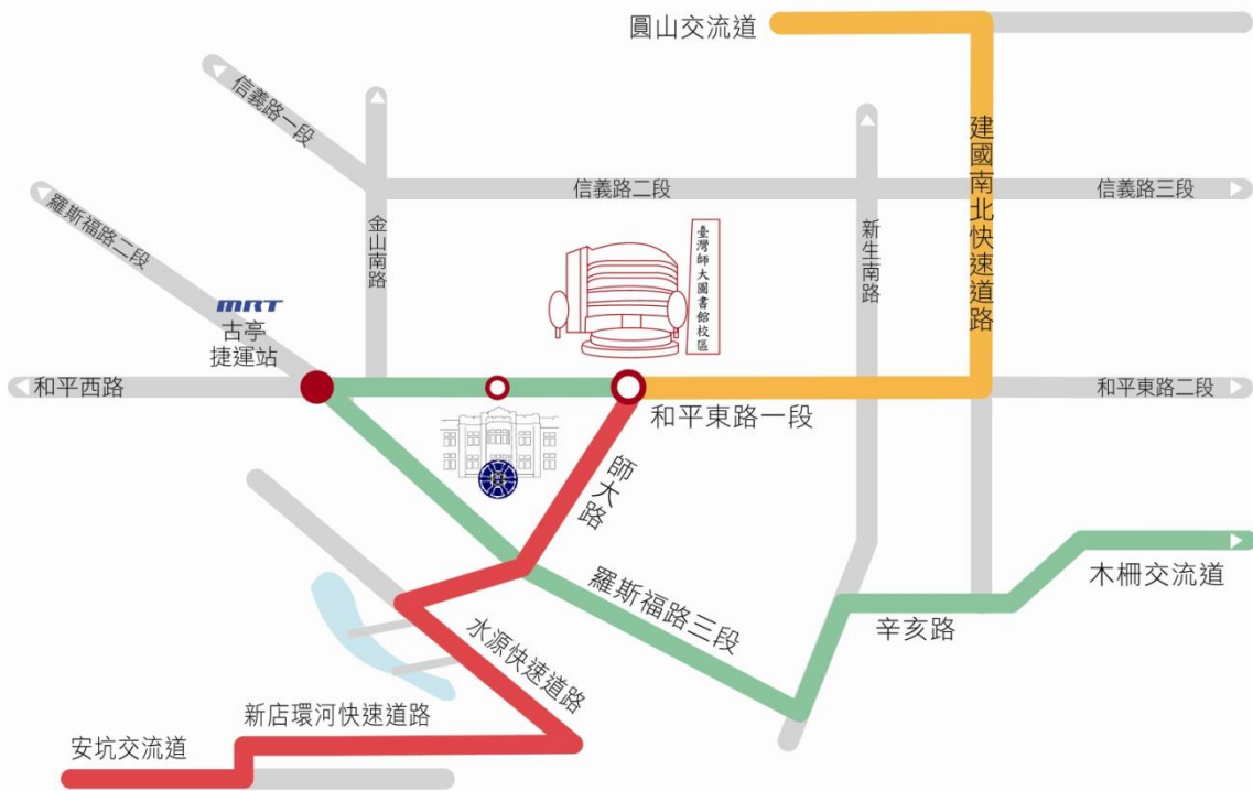
國立臺灣師範大學校園高速公路指標