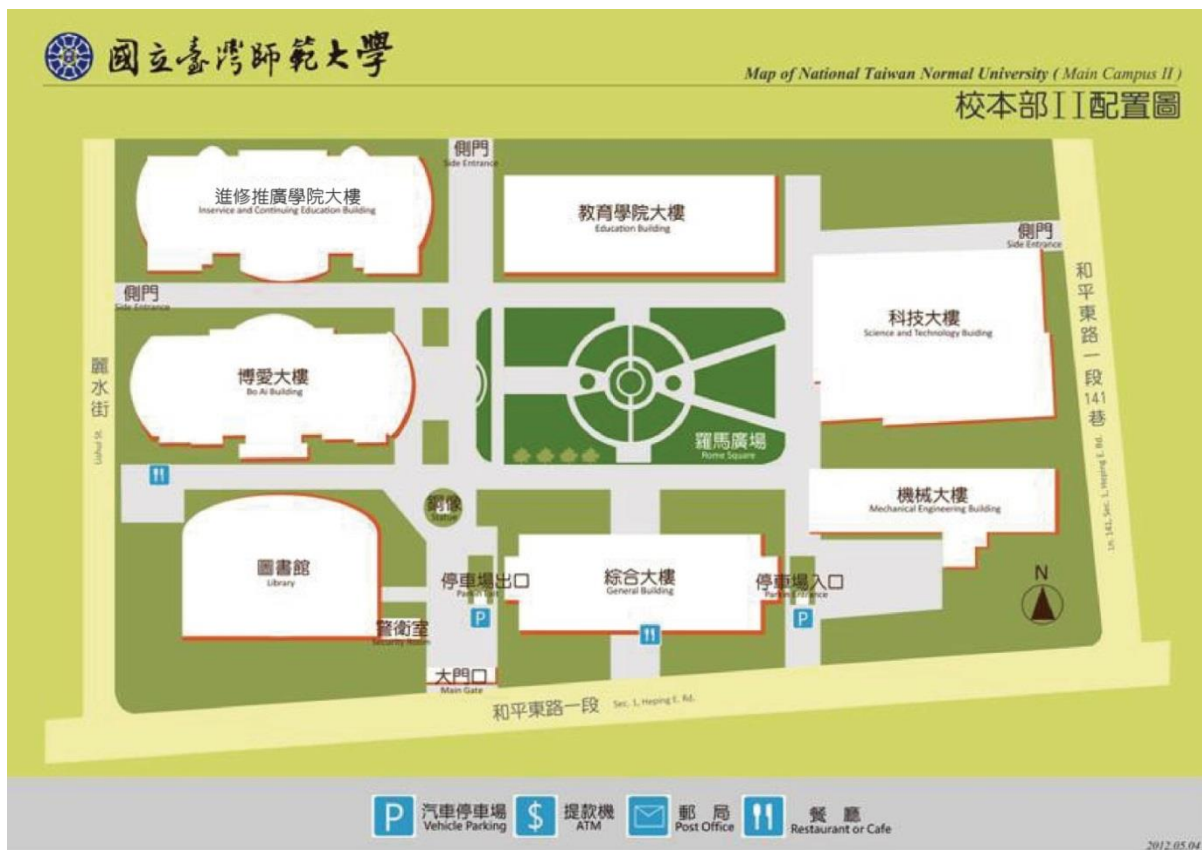
國立臺灣師範大學圖書館校區配置圖