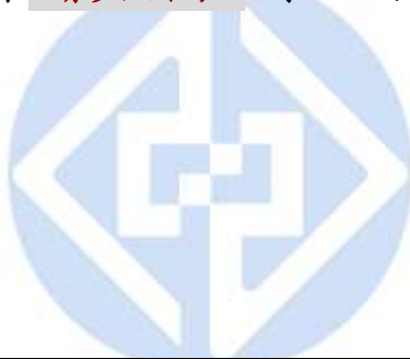
應繳證明文件參考表

-----證--明--文--件--影--本<請參照下表>--浮--貼--處--(A4 紙張大小為宜)-----