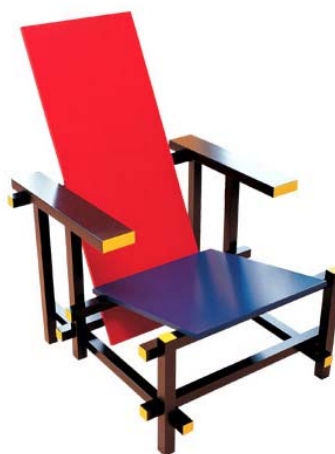
圖 3. 里特維爾德設計的紅藍椅